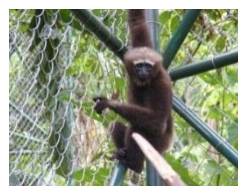
Dawn (femelle, 6-7ans)