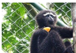
Espoir (mâle, 9 ans)

La réhabilitation a été une des préoccupations majeures en 2010. Grâce à l'aide des sponsors et suite aux tests de santé négatifs, cinq individus ont été admis en zone de réhabilitation en 2010. Deux individus sont à ce jour prêts à être réintroduits dans la nature (voir ci-dessous). Ils seront mis en contact en janvier 2011 et ils pourraient être le premier couple relâché par HURO.